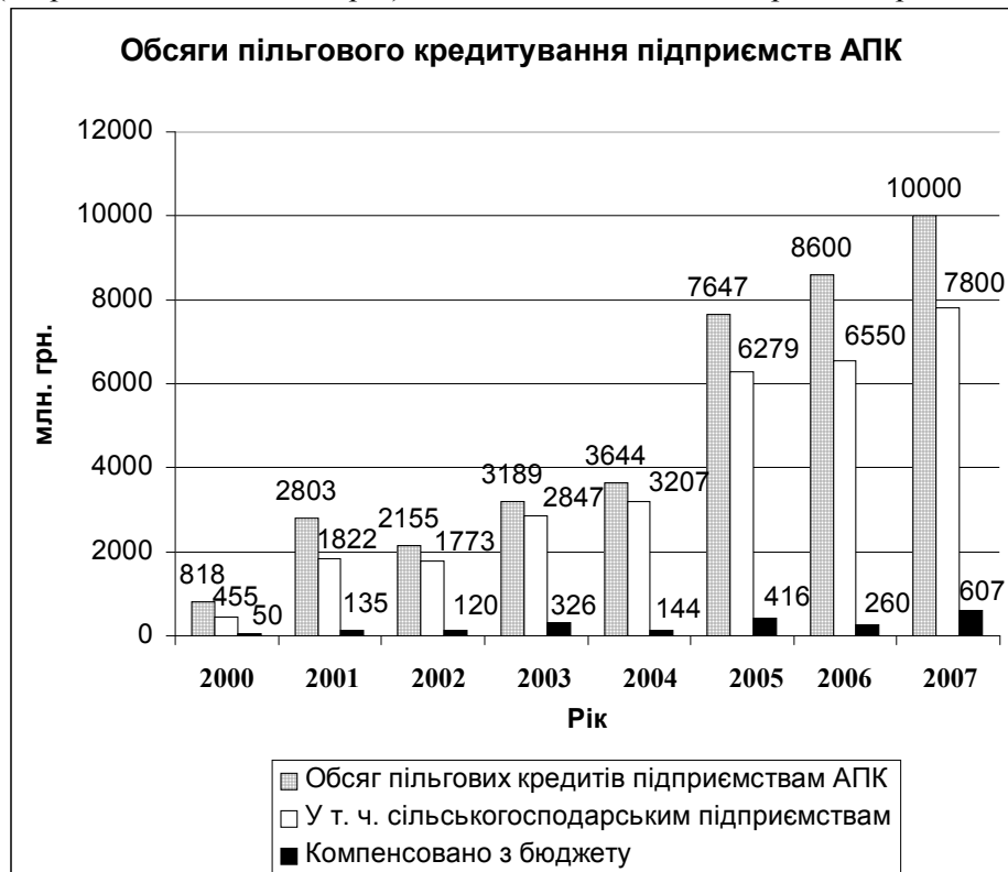
Рис. 2. Обсяги пільгового кредитування підприємств АПК України

Для фермерів, які беруть участь у визначених конгресом США програмах, щорічно затверджуються гарантовані державні ціни на сільськогосподарську продукцію. Крім того, після підписання відповідних контрактів фермерам надається можливість отримати некомерційну безвідсоткову позику розміром до 50% загальної вартості майбутньої продукції. З метою підтримки виробника також передбачена щорічна державна програма (в межах 40 млрд. дол.) для надання допомоги малозабезпеченим верствам населення продуктами харчування через застосування продуктових талонів. Існують ще й окремі державні програми підтримки експорту сільськогосподарської продукції і продовольства. Прийнятним для України може бути також досвід Канади, Німеччини, Польщі та інших аграрно розвинених країн. Загалом аналіз міжнародного досвіду свідчить, що у розвинених країнах обсяги державної підтримки сільськогосподарських товаровиробників коливаються в межах 30-40%, а в окремих (зокрема, Японії, Швейцарії) доходять навіть до 70% вартості виробленої продукції.