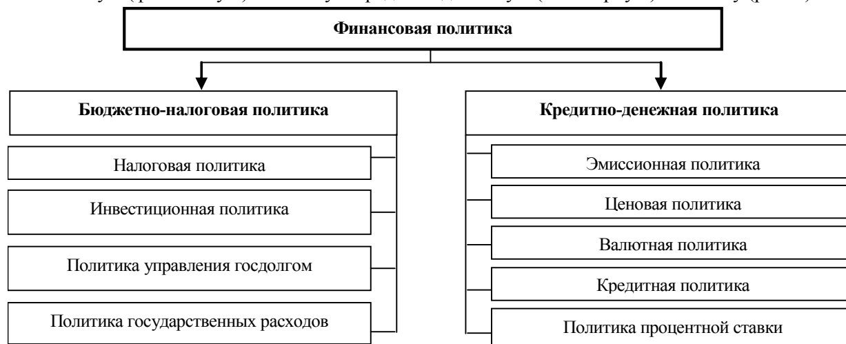
Рис. 1. Направления и виды финансовой политики

По нашему мнению, в составе финансовой политики следует выделять два направления: бюджетно-налоговую (фискальную) политику и кредитно-денежную (монетарную) политику (рис. 1).